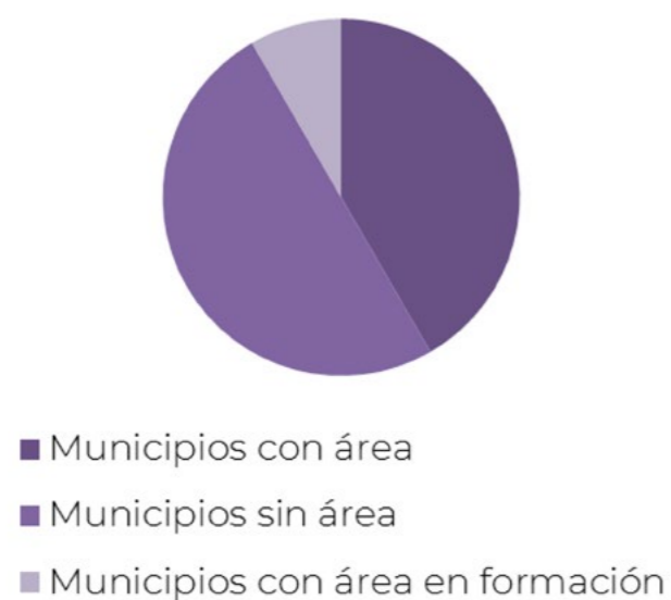
Cuadro N° 1